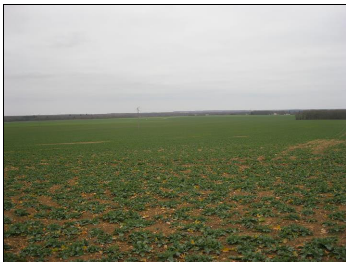
Vue du point d'implantation du forage projeté aux CHÊNES MALINGUES (COULOMBS – 28) et de aperçu de son environnement (Photographies : GéoSen – 15-janv-19)